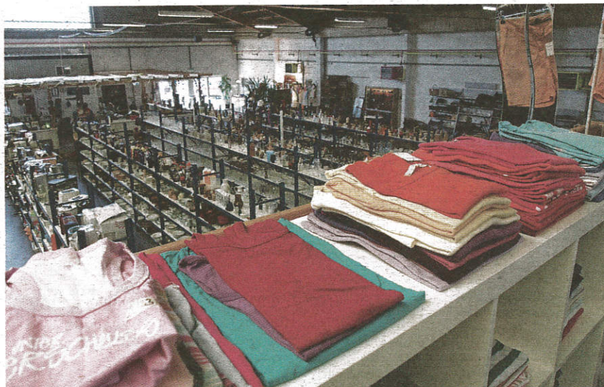
Ein breites Angebot an Möbeln, Geschirr und Trouvaillen

Mit dem BrockiShop Telli betreibt das Blaue Kreuz, neben dem Ladengeschäft in Oberentfelden, seit etwas mehr als einem Jahr erfolgreich einen zweiten Shop im Landanzeiger-Gebiet.