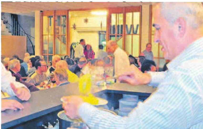
Ein feines Essen gehört zum gemeinsamen Beisammensein dazu